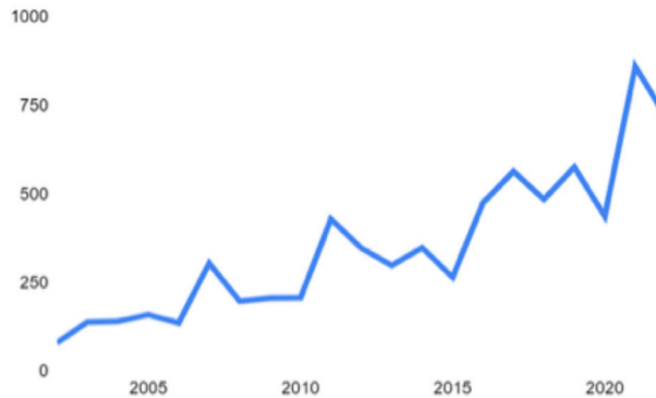
Figura 1: Evolución del superávit comercial de la Argentina con Bangladesh

Nota. Elaboración propia a partir de los datos del sistema de consulta de comercio exterior de bienes del Instituto Nacional de Estadística y Censos (INDEC).